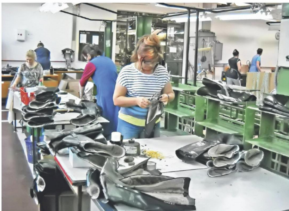
Осим погона, „Борели“ планира и поновно отварање својих продавница

БЕОГРАДСКА ФИРМА „ДАРФУР“ ПОКРЕНУЛА ПРОИЗВОДЊУ У „БОРЕЛИЈУ“