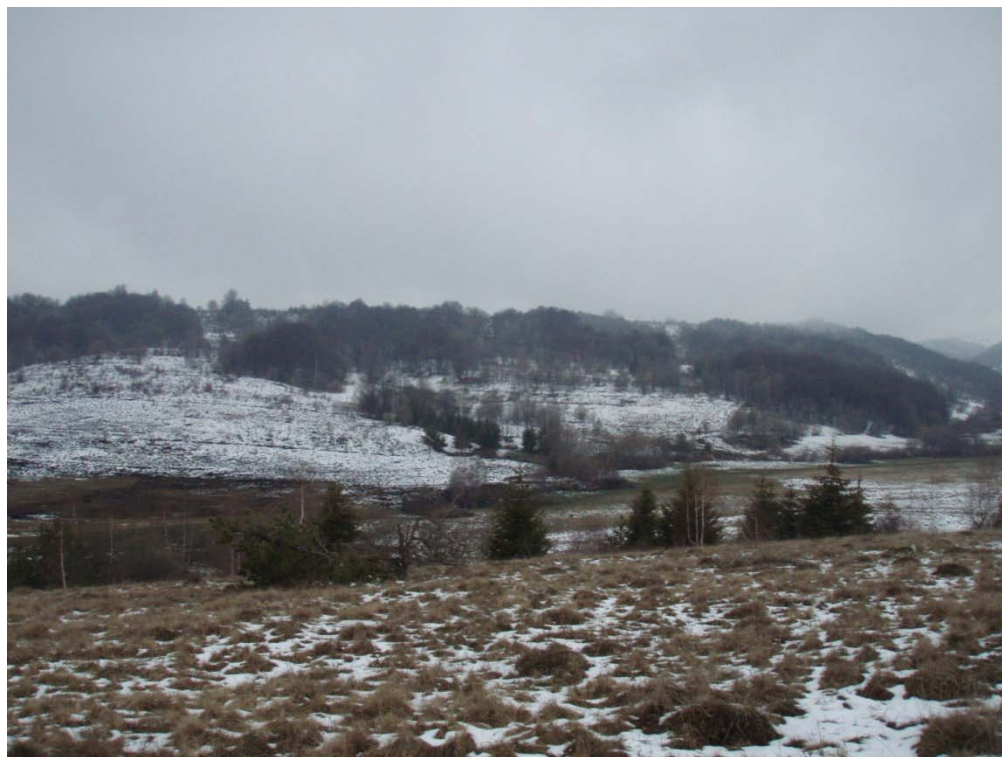
Фотографије постојећег стања предметне локације