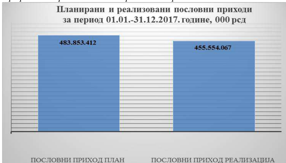
Графикон 1. Приказ пословних прихода за период 01.01.-31.12.2017. године

У периоду 1. јануар – 31. децембар 2017. године јавна предузећа су остварила пословне приходе у износу од 455.554.067.000 динара. Програмима пословања за 2017. годину, планирани су пословни приходи у износу од 483.853.412.000 динара. Остварени пословни приходи су за 6% мањи од планираних.